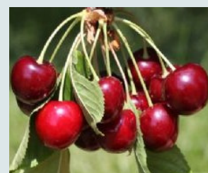
Bigarreau Tardif de Vignola Ferme, croquante, sucrée, juteuse et parfumée