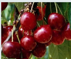
Bigarreau Géant d'Hedelfingen Fine, sucrée, juteuse et parfumée