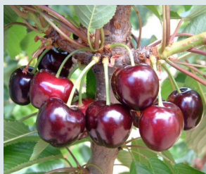
Bigarreau Burlat Ferme, sucrée et très parfumée.