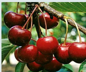
Bigarreau Van Ferme et sucré.