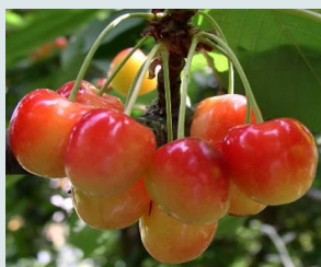
Bigarreau Napoléon Ferme, juteuse et sucrée.