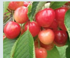
Bigarreau Rainier Ferme, juteuse, sucrée et parfumée.