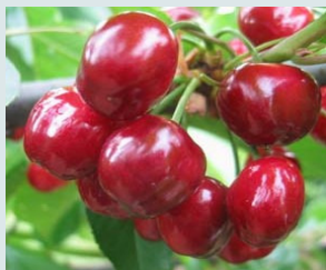
Bigarreau Summit Ferme, sucrée et très parfumée. Gros fruits.