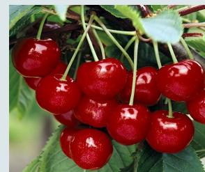
Early Rivers Guigne tendre juteuse et sucrée.