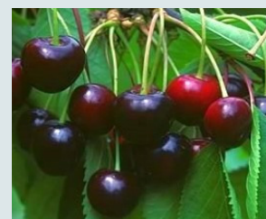
Bigarreau Reverchon Fine, croquante, juteuse, sucrée et légèrement acidulée.