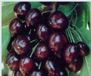
Bigarreau Moreau Ferme et sucrée.