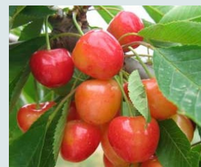
Bigarreau Cœur de Pigeon Ferme, sucrée et acidulée.