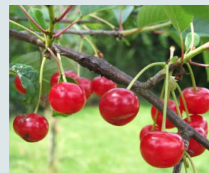
Montmorency Parfumée et acidulée. Griotte, idéale pour des cerises à l'eau de Vie.