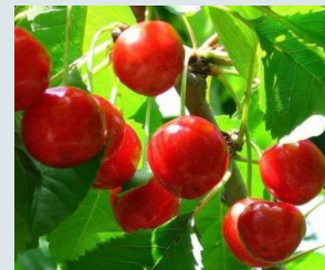
Anglaise Hative Fine, juteuse, sucrée et acidulée.